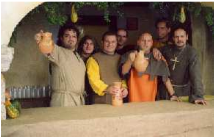
PARTE DEL GRUPPO "IMPEGNATO" A VENZONE