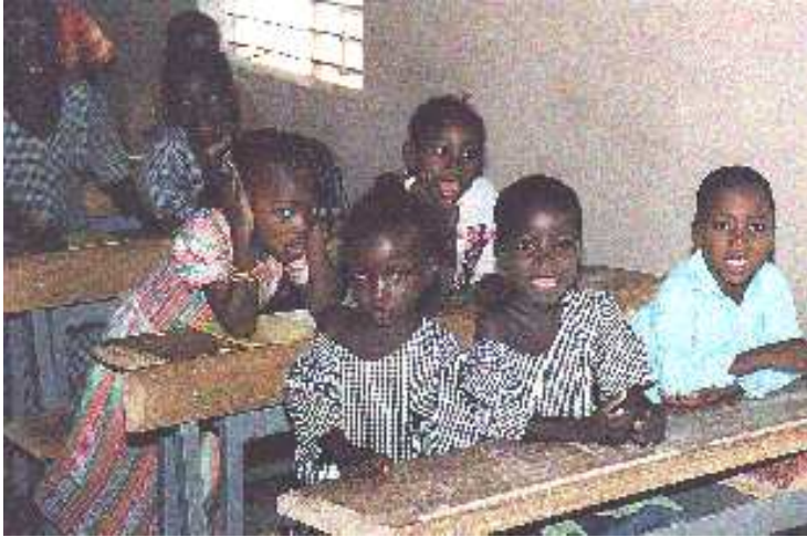
Scolari al Centro Oasis