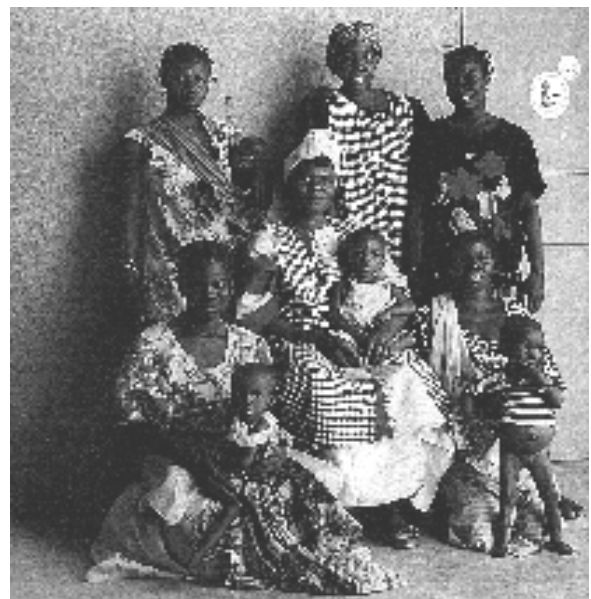
Mamme e bimbi al Centro Oasis

mi piacerebbe che poteste essere qui con me a godere della visione della savana sotto la pioggia e sentire il rumore che fa cadendo sul tetto di paglia o su quello di lamiera. Fa venir voglia di chiudere gli occhi e lasciarsi andare in un dormiveglia piacevolissimo. Ma è altrettanto bello osservare come gli animali sentono l'arrivo della pioggia molto prima che si manifesti, ed altrettanto accade per le persone che vivono nel profondo della savana. Sentono l'avvicinarsi di tutti i fenomeni naturali come se la natura li avvertisse in anticipo perché possano correre ai ripari. Le poche scimmie ri-